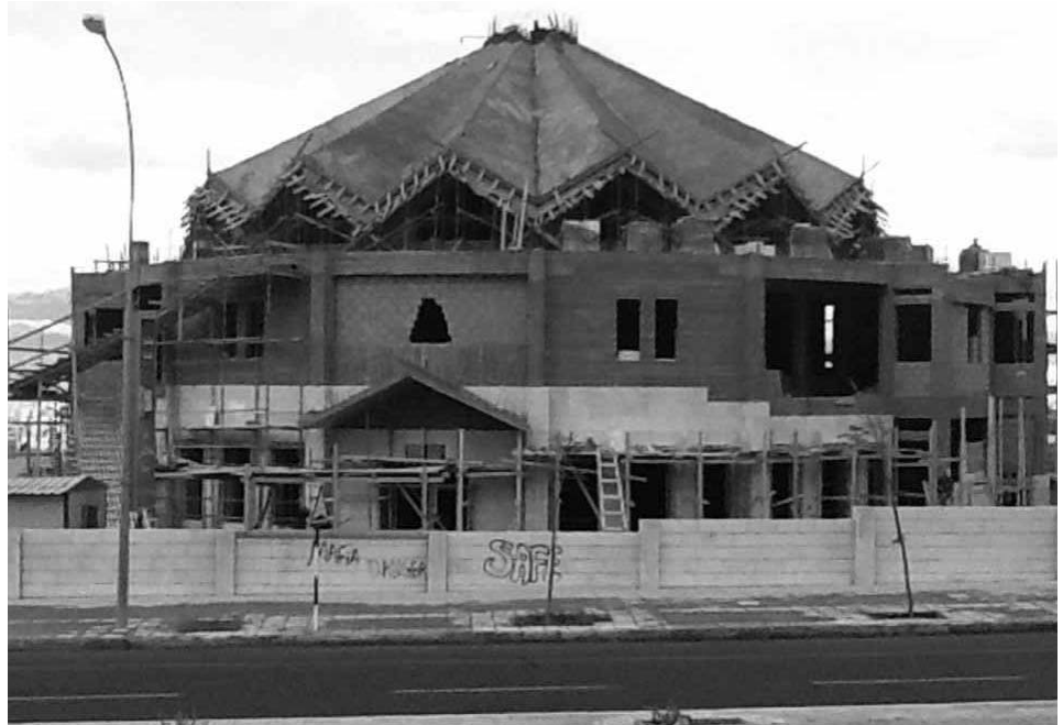
L'état d'avancement des travaux de construction, fin mars 2012, de l'église Stella Maris à Aqaba

L'Ordre Equestre du Saint-Sépulcre de Jérusalem, en 2012, est encore engagé dans la réalisation des deux projets les plus lourds du Patriarcat Latin dont les travaux ont été entrepris l'année dernière : la construction à Aqaba, en Jordanie, de l'Eglise paroissiale Stella Maris et de son annexe, une grande salle multifonctionnelle, et à Rameh, en Galilée, de l'Ecole supérieure.